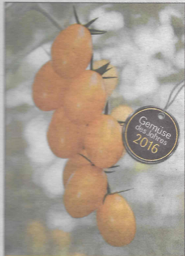
Der Paradeiser für'n Kaiser!